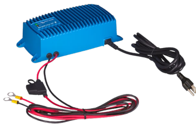
Blue Smart IP67 Ladegerät 12/25