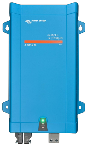
MultiPlus 1200 VA