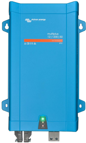
MultiPlus 1200 VA